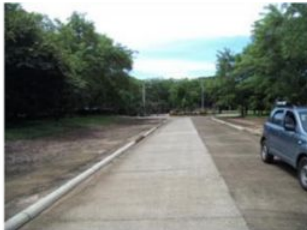
Calle privada del condominio que habilita la propiedad