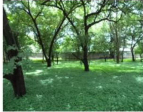
Perspectivas internas de la propiedad